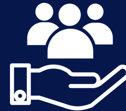
Prestação de serviços